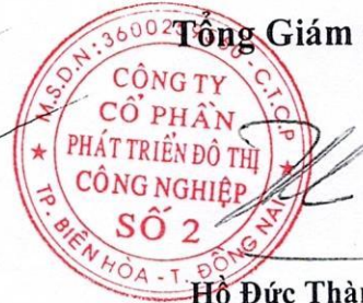
Hồ Đức Thành